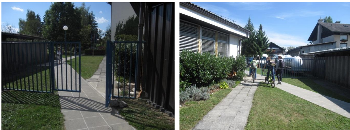
Slika 12: nevarna točka 2 - poti v šolskem parku.

V suhih in nekoliko toplejših dnevih se skozi park pred šolo vozi veliko kolesarjev, predvsem učencev sosednje osnovne šole. V začetku šolskega leta 2016 / 2017 smo vstop v park opremili z vrati in s tem vhod zožali. Hitrost kolesarjev skozi park se je nekoliko upočasnila, vendar množičnost kolesarjev še vedno predstavlja nevarnost za naše učence in druge pešce v parku. Na obeh straneh vstopa v park smo tudi postavili znaka: prepovedan promet za kolesa , ki pa jih kolesarji še vedno ne upoštevajo.