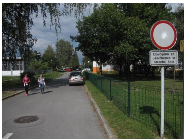
Slika 14: nevarna točka 4 - dovozna pot oz. pot do šolskega vhoda in dvigala.

V šolskem letu 2015 / 2016 smo šolski park ogradili in tako preprečili prehod učencev sosednje šole preko dovozne poti. Prehod učencev je bil zelo nevaren, še posebej, če so bila ob cesti parkirana vozila. Ker je na poti še vedno večje število pešcev in kolesarjev, moramo biti vozniki nanje zelo pozorni.