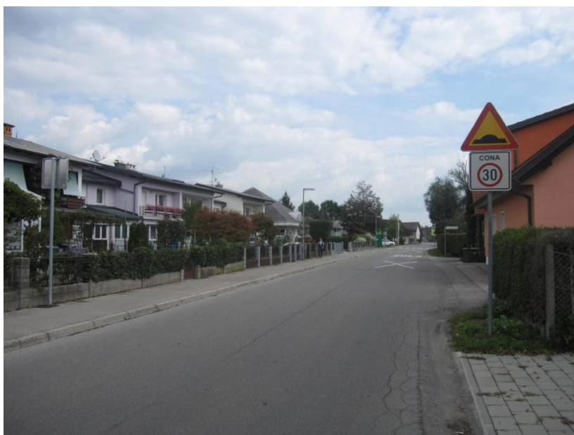
Slika 18: začetek in konec cone 30 Km/h na Kettejevi ulici (pri vrtcu Ostržek).

Vse ceste v okolici šole (Kettejeva, Trdinova, Šolska, Šubljeva) in še nekatere druge, so v coni 30 Km /h. Cona je zelo velika, zato vozniki pogosto pozabijo, da vozijo v coni 30 Km /h, saj je razdalja od vstopa v cono in izstopa iz nje več kot 500 m. Predlagam, da se v coni postavi več opozorilnih znakov, da se nahajamo v coni 30 Km/h. Spodnje slike prikazujejo vstopne in izstopne točke iz cone 30 Km /h.