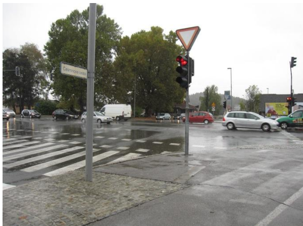
Slika 23: nevarna točka 9 - križišče Breznikove ulice in regionalne ceste Želodnik – Domžale (pri Petrolovi bencinski črpalki).

To križišče je zelo prometno, zato moramo spremljevalci, pri prečkanju večje skupine učencev, še toliko bolj skrbno organizirati prečkanje. Po potrebi se oblikuje več ločenih skupin.