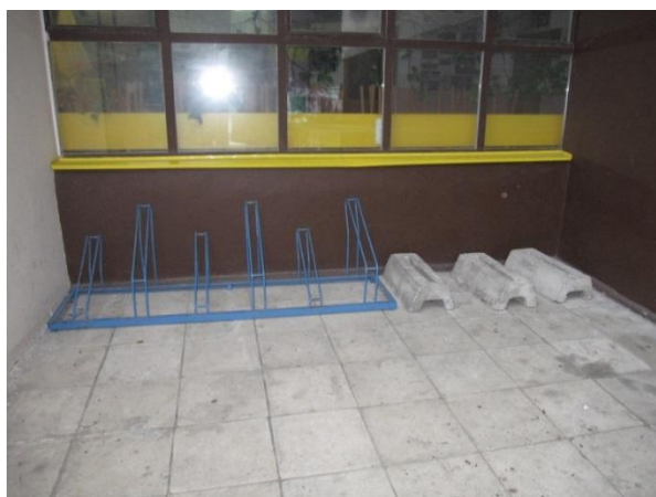
Slika 9: urejena in pokrita šolska kolesarnica.

Pogoj za prihod v šolo s kolesom je opravljen kolesarski izpit, uporaba primerne kolesarske varnostne čelade ter popolnoma brezhibna in opremljena kolesa.