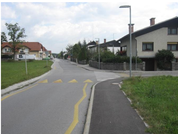
Slika 28: nevarno križišče Šolske in Šubljeve ulice.

Križišče je nevarno predvsem zato, ker ni znakov za določitev prednostne ceste. V tem križišču enakovrednih cest se pogosto kršijo cestno-prometni predpisi.