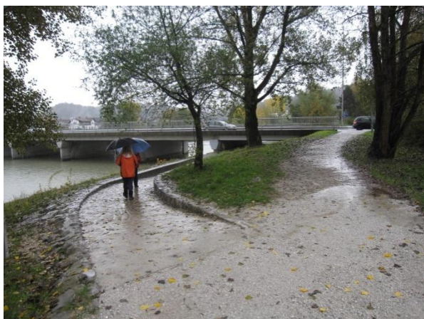
Slika 25: varnejši prehod B - podhod pod regionalno cesto Želodnik – Domžale (ob Kamniški Bistrici).

Iz vzhodnega predela Domžal proti šoli in obratno lahko koristimo podhod pod regionalno cesto Želodnik – Domžale pri Kamniški Bistrici. Na tej poti je potrebno paziti na kolesarje in hoditi po desni polovici makadamske poti.