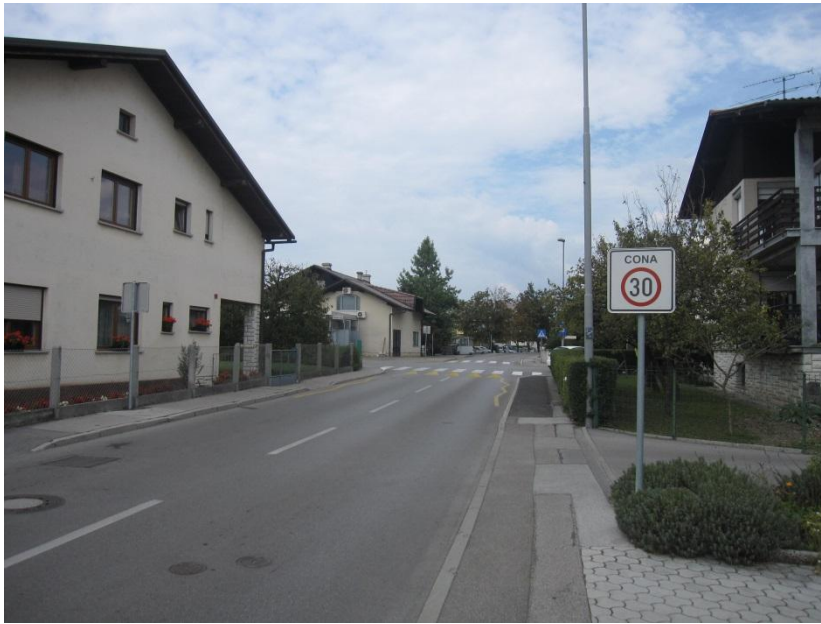
Slika 20: začetek in konec cone 30 Km/h na Perkovi ulici (pri podružnični OŠ Rodica).