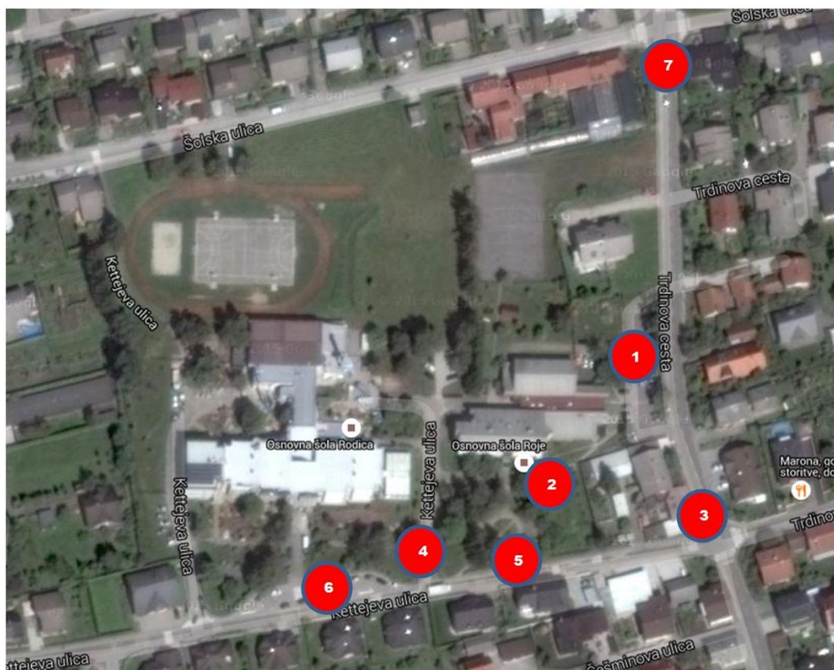
Slika 11: nevarna točka 1 - šolsko parkirišče.