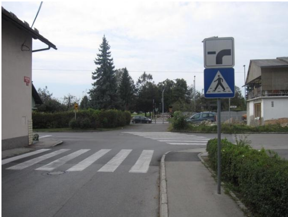
Slika 26: nevarno križišče Kettejeve in Perkove ulice.

Križišče je nepregledno in nevarno, ker vozniki lahko spregledajo potek prednostne ceste.