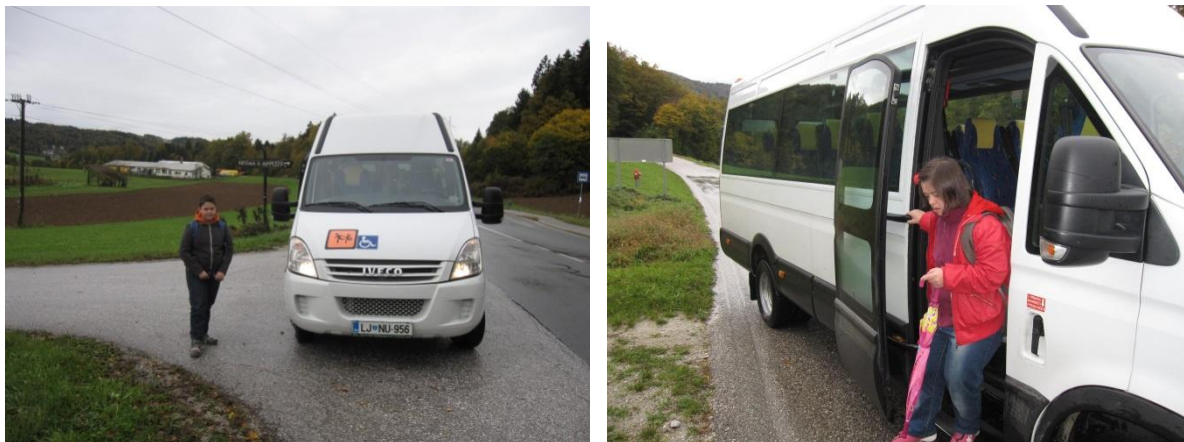
Slika 5: primer vstopnega in izstopnega mesta, kjer na poti ustavlja šolski kombi-bus.

Šofer ustavi kombi-bus na varnem mestu in zavzame takšen položaj, da prepreči drugim vozilom, motoristom ter kolesarjem vožnjo mimo vhodno-izstopne točke.