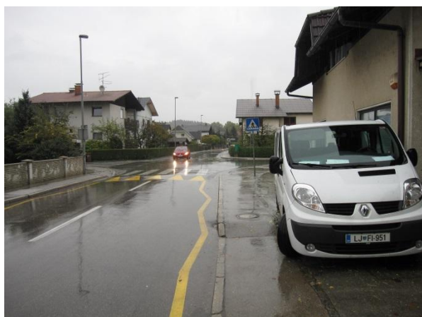
Slika 13: nevarna točka 3 - križišče Trdinove ceste in Kettejeve ulice.

Križišče je sicer lepo urejeno vendar manj pregledno in pogosto predstavljajo problem vozila parkirana na pločniku, ki povezuje križišče s šolskim parkiriščem. Zato je varneje uporabljati pločnik na Kettejevi ulici, ki povezuje križišče s šolskim parkom.