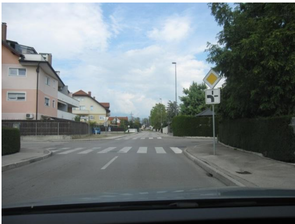
Slika 27: nevarno križišče Šubljeve ulice in Trdinove ceste.

Tudi na tem križišču vozniki pogosto spregledajo potek prednostne ceste.