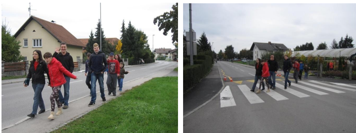
Slika 17: nevarna točka 7 - križišče Trdinove ceste in Šolske ulice.

Pločnik na Trdinovi cesti od šole proti križišču s Šolsko ulico je sorazmerno ozek. Pri učnem sprehodu z večjo skupino učencev je potrebno paziti, da učenci ne stopajo na vozišče.