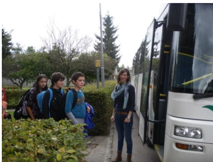
Slika 4: Učenci pri vstopu na šolski avtobus.

Avtobus je vedno parkiran na pločniku, tako da avtomobili ne vozijo čez vstopno in izstopno točko avtobusa. Pri vstopu učencev je z njimi vedno spremljevalec.