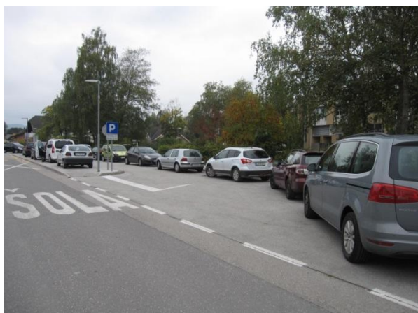
Slika 16: nevarna točka 6 - izogibališče pri sosednji Osnovni šoli Rodica.

Izogibališče pri sosednji šoli je pogosto zaparkirano z osebnimi avtomobili, zato vanj ne more zapeljati avtobus. Poleg tega je vozišče manj pregledno in lahko pride do nezgode.