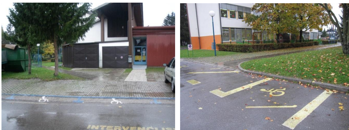
Slika 8: obračališče za avtomobile staršev, ki v šolo pripeljejo otroke in se poslužujejo dvigala (za gibalno ovirane).