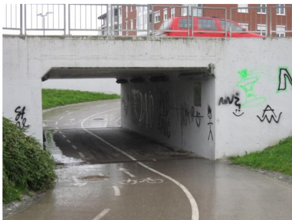
Slika 24: varnejši prehod A - podhod pod regionalno cesto Želodnik – Domžale (pri trgovinskem centru Breza).

Iz centra Domžal proti šoli in obratno je varneje koristiti podhod pri trgovinskem centru Breza. Pri tem je potrebno paziti, da hodimo po pločniku oz. pasu rezerviranem za pešce in ne po kolesarski stezi.