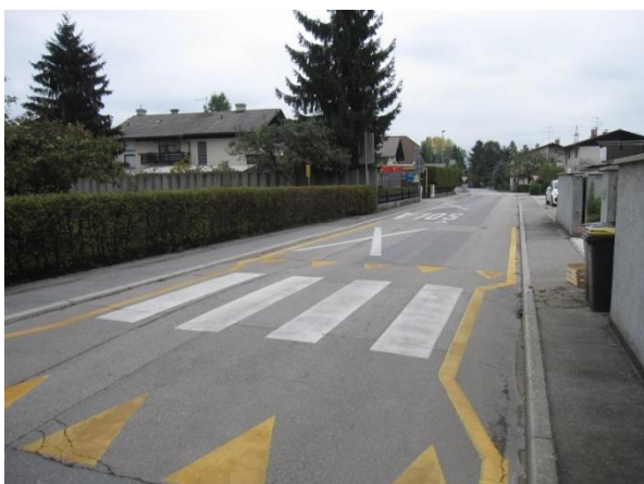
Slika 15: nevarna točka 5 - prehod za pešce na Kettejevi ulici in mesto kjer ustavlja šolski avtobus.

Vozniki pa moramo biti zelo pozorni tudi pri izhodu iz dovozne poti na Kettejevo ulico, saj je zaradi žive meje preglednost zmanjšana. Predlagamo, da se to nevarno mesto opremi z ogledalom .